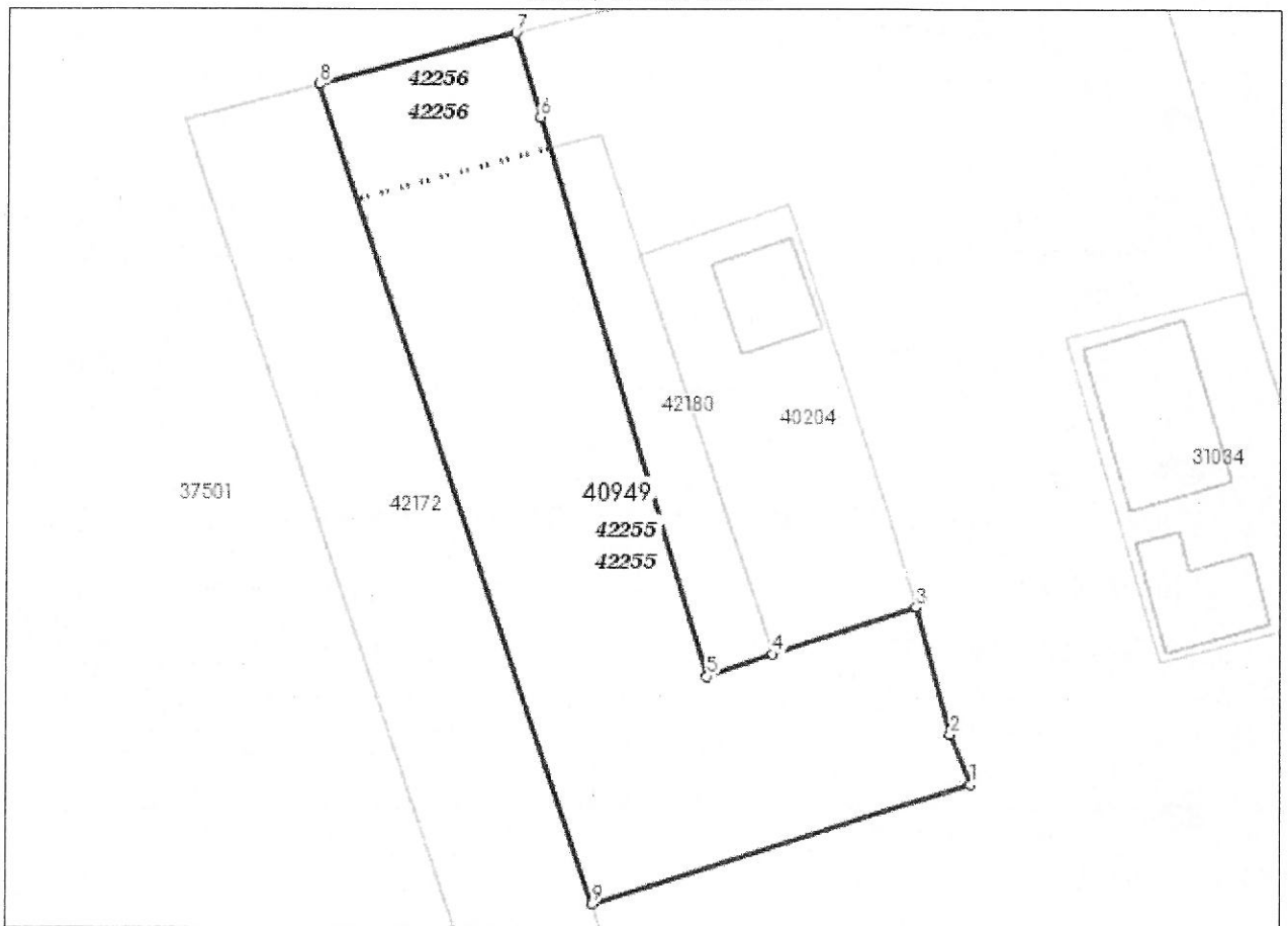
DETALII LINIARE IMOBIL

* Suprafața este determinată în planul de proiecție Stereo 70.